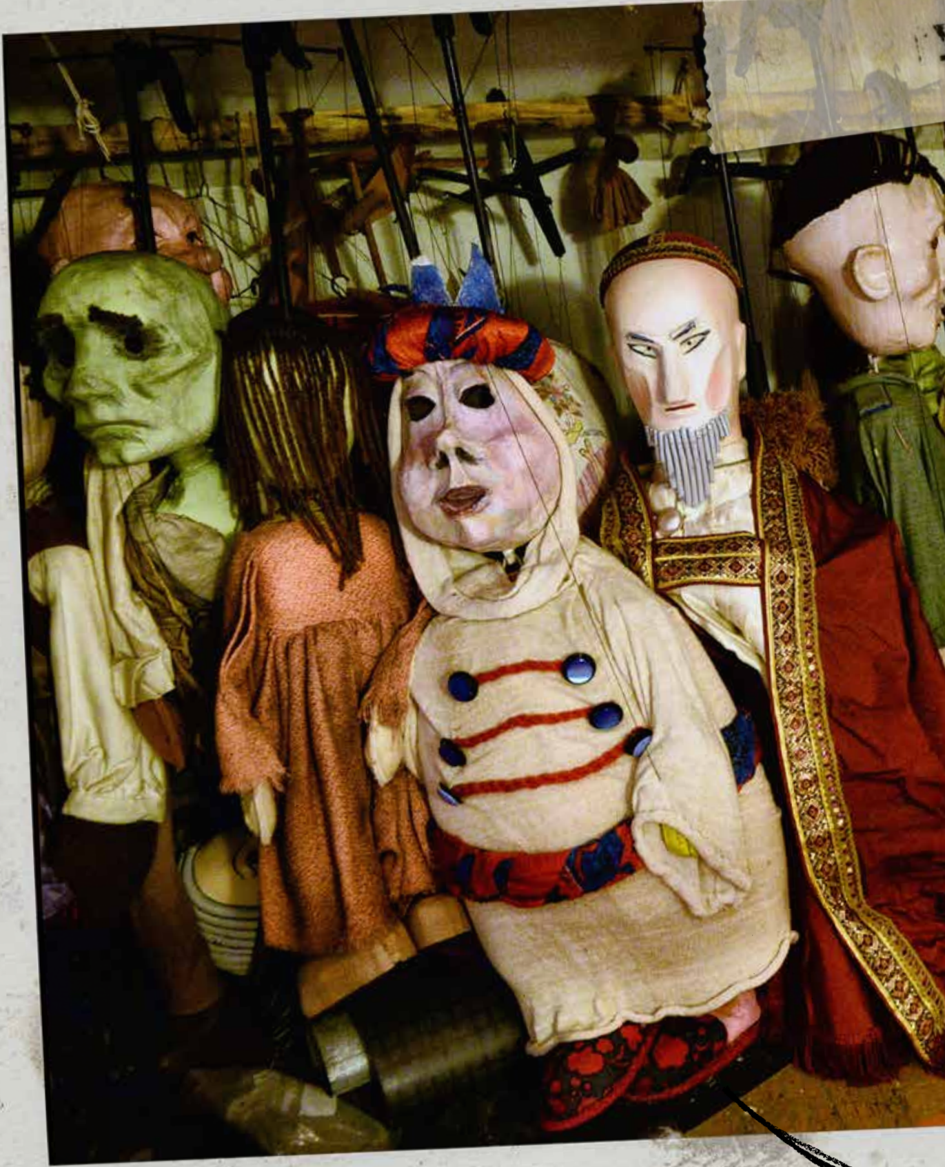
Marionettes de Felix Mirbt © Christina Alonso, expo Mons 2015 Felix Mirbt's puppets © Christina Alonso, Mons exhibition 2015