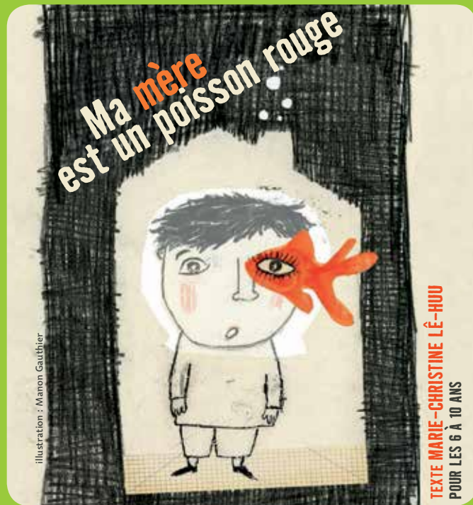
illustration : Mamon Gauthier

Direction artistique : Marie-Christine Lê-Huu